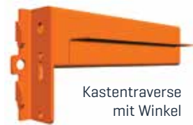
Kastentraverse mit Winkel